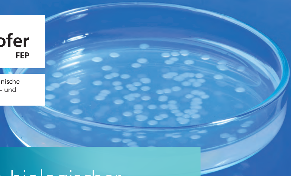
Keimwachstum auf Agarplatte