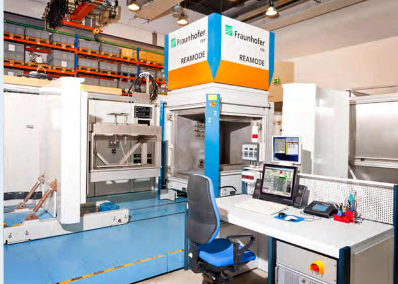
REAMODE Elektronenstrahl-Versuchsanlage im Fraunhofer FEP